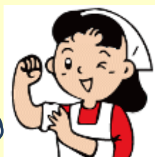
アリスの愛ちゃん